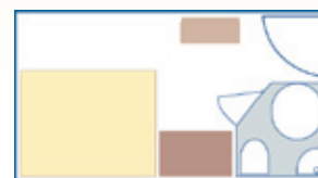
Cabina con cama doble