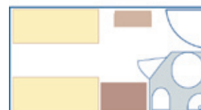
Cabina doble con 2 camas