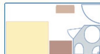
Cabina con cama doble