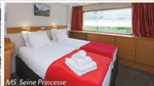
MS Seine Princess