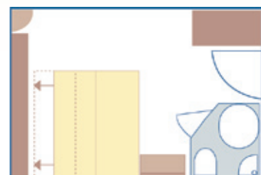
Cabina doble con cama separable.

Todas las cabinas son con cama doble convertible excepto las marcadas con HU o CU.